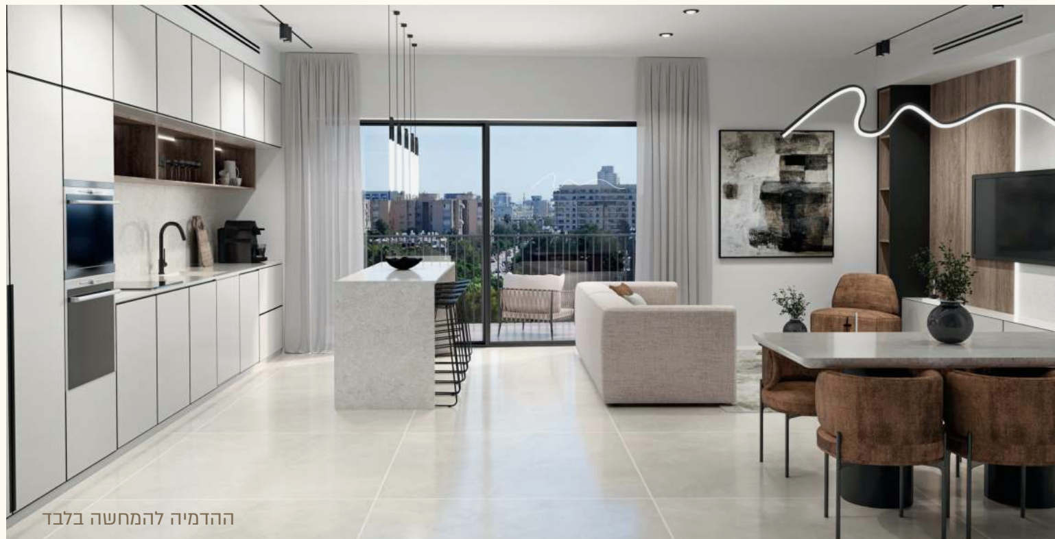
ההדמיה להמחשה בלבד