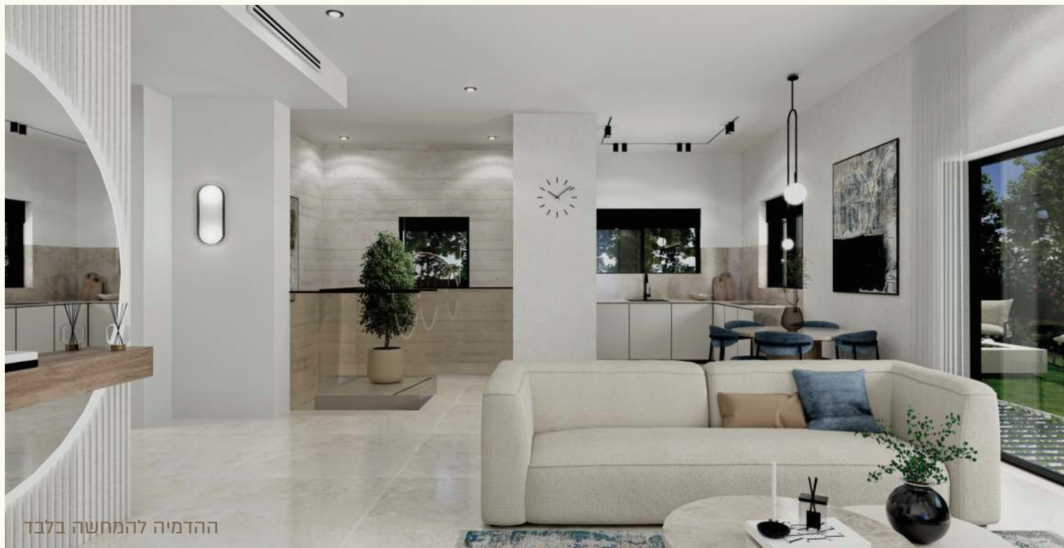
ההדמיה להמחשה בלבד